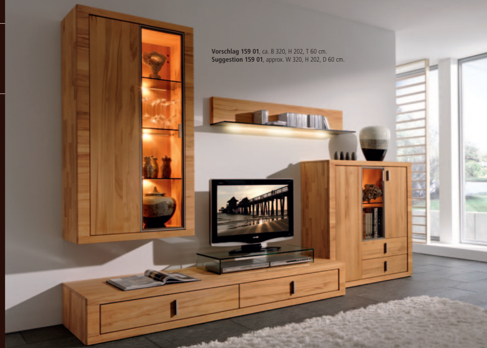
Vorschlag 159 01, ca. B 320, H 202, T 60 cm. Suggestion 159 01, approx. W 320, H 202, D 60 cm.