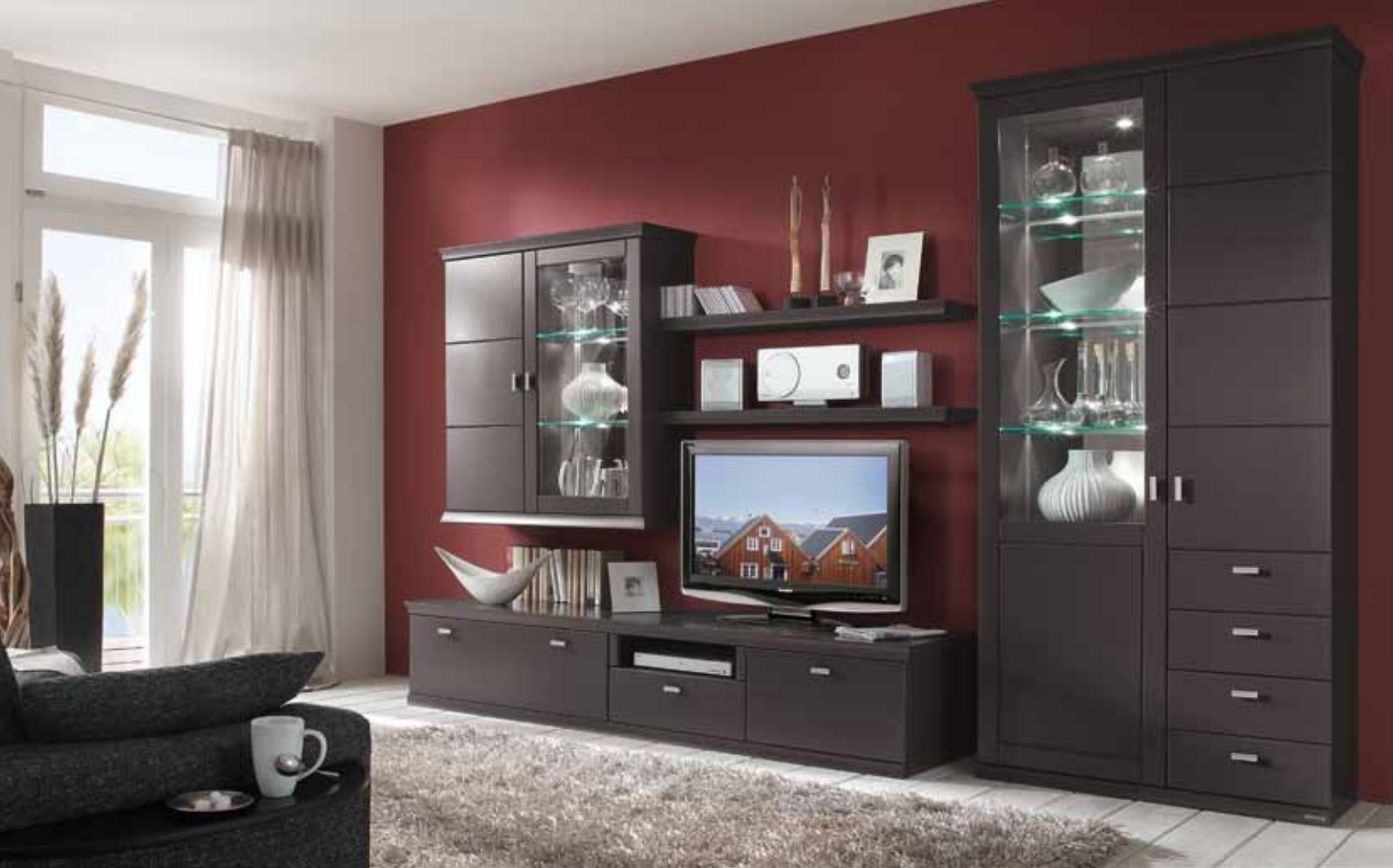
KORSIKA in Lack graphit: Vorschlag 4629 , ca. B 360, H 223, T 57 cm.