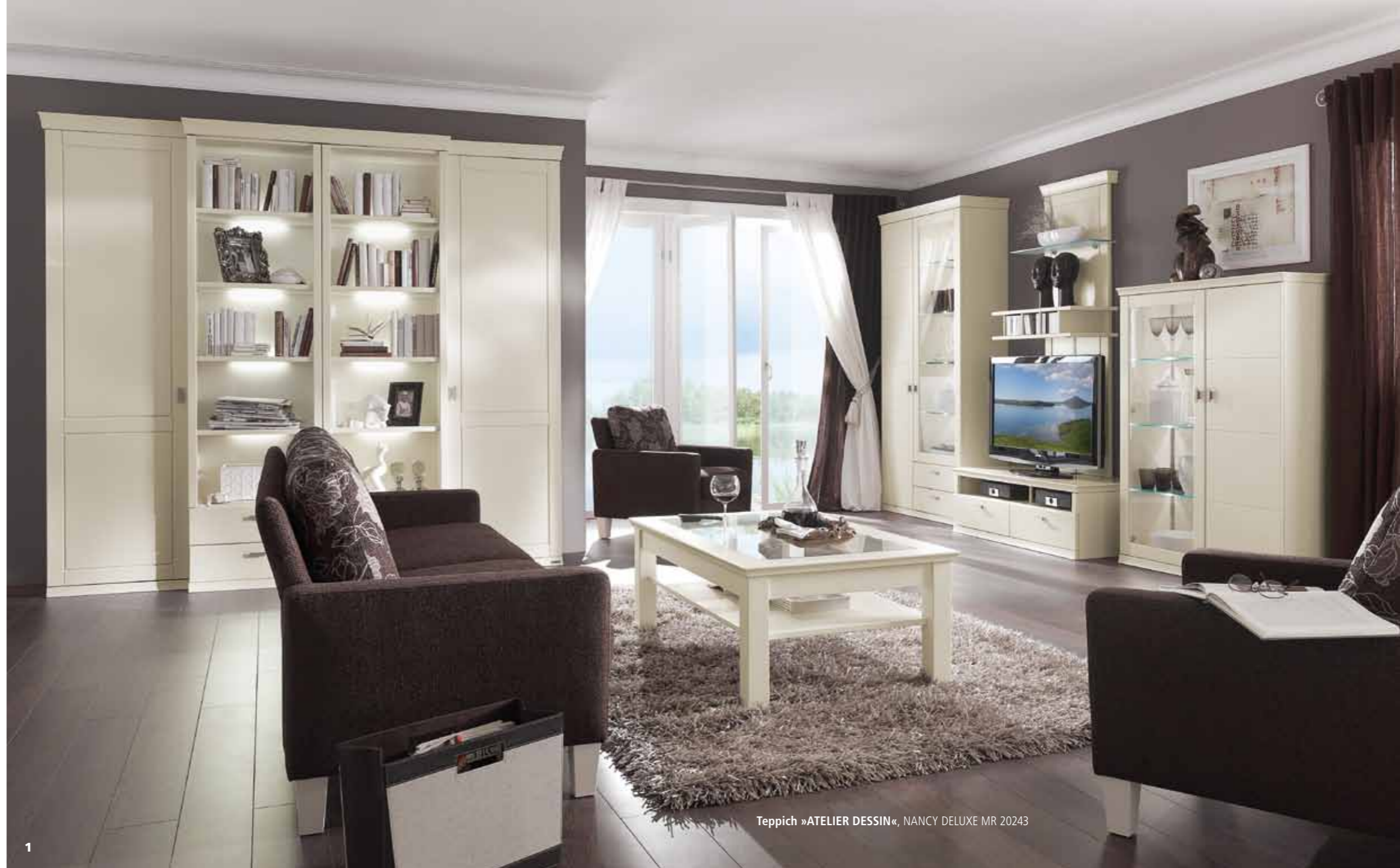
Teppich »ATELIER DESSIN«, NANCY DELUXE MR 20243