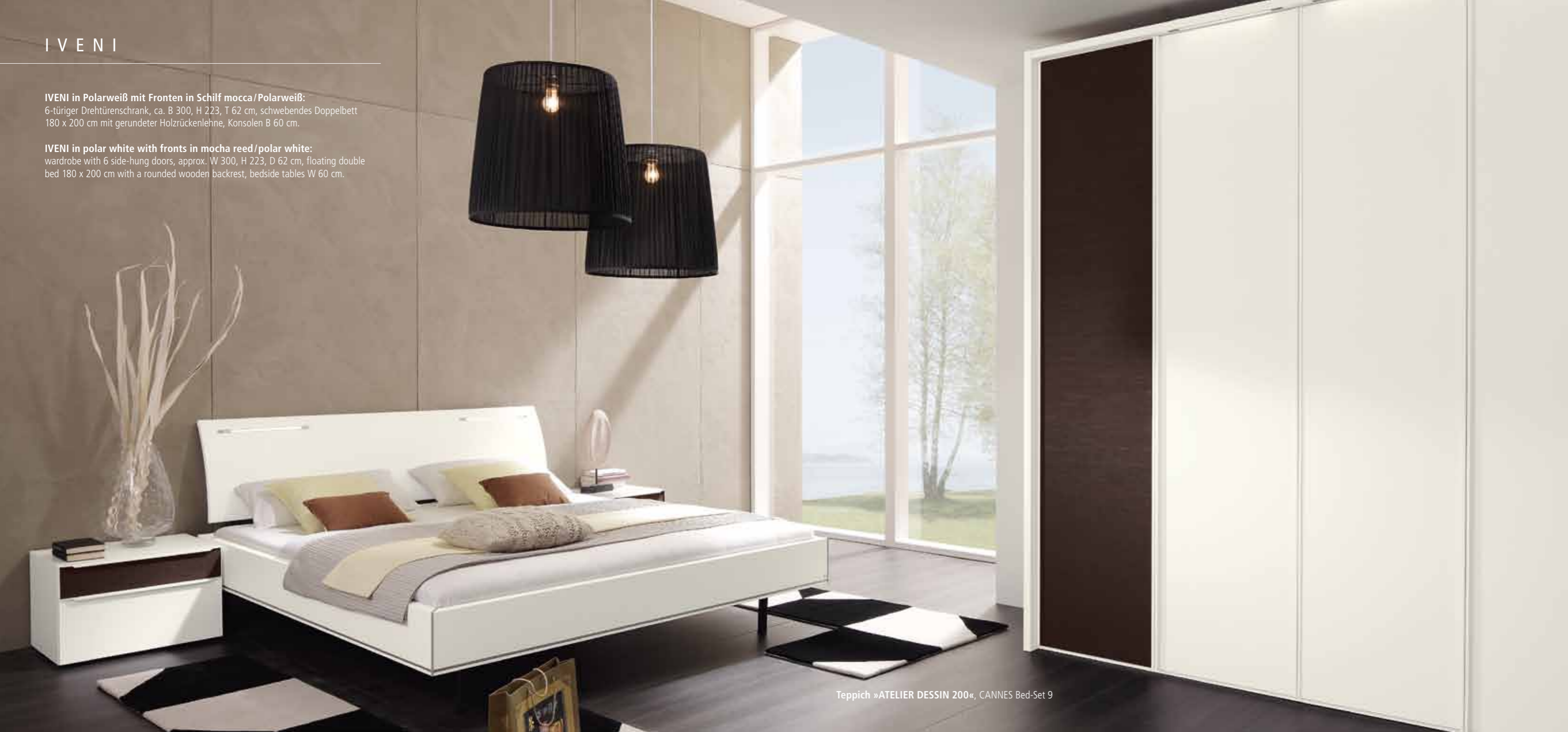
Teppich »ATELIER DESSIN 200«, CANNES Bed-Set 9

IVENI in polar white with fronts in mocha reed/polar white: wardrobe with 6 side-hung doors, approx. W 300, H 223, D 62 cm, floating double bed 180 x 200 cm with a rounded wooden backrest, bedside tables W 60 cm.